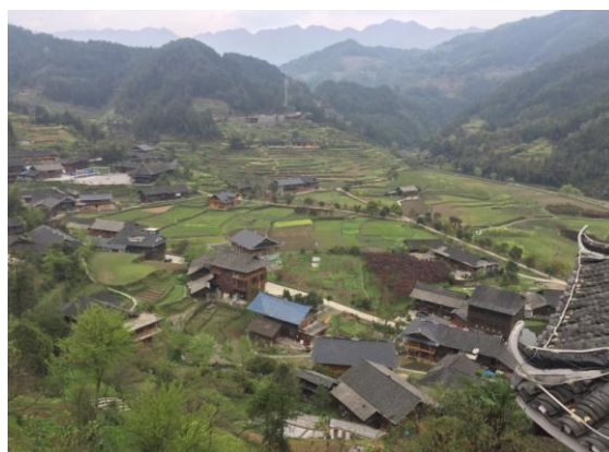
参观奉家镇乡村旅游产业园

工作队加强了驻村帮扶工作的宣传。南华大学第二轮驻村帮扶工作队进驻涟源第二天，娄底新闻网和娄底日报即播出南华大学驻村帮扶工作队进驻涟源古塘的新闻。涟源市各类扶贫会议业已出现南华大学的名字，在4月2日古塘乡召开古塘乡脱贫攻坚“补短板、强弱项”专项行动会上，乡领导积极宣传南华大学进驻古塘申家村，古塘干部已经家喻户晓。与此同时，工作队在村部、村道口等显眼的地方制作了各类广告标语，向村民告知南华大学的到来。