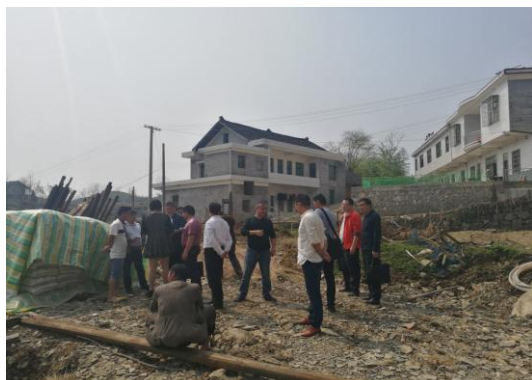
易地扶贫搬迁拆旧复垦现场查验