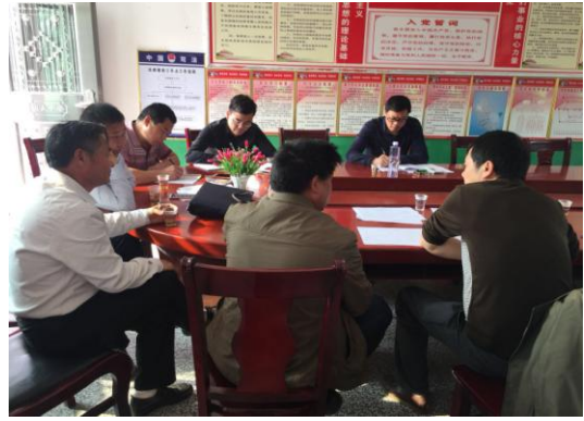
申家村扶贫工作现场培训会

自进入申家村第一天，工作队与村支两委以最快的速度拉近心灵的距离，一个月来，村支两委带领我队全体成员踏遍申家的山山水水，了解村情村貌，认识申家的乡里乡亲，接触处理村里各类事务。