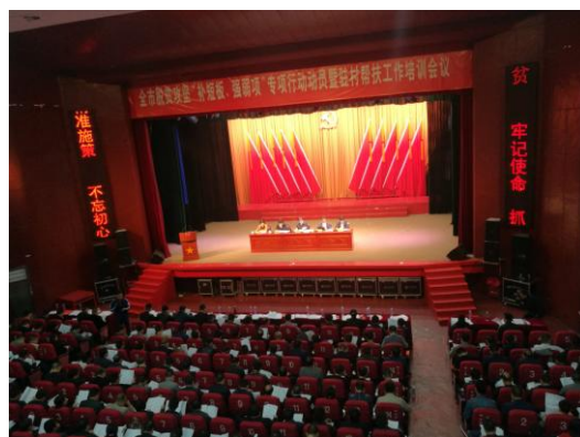
涟源市“补短板、强弱项” 专项行动暨驻村帮扶工作培训会