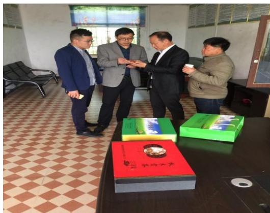
参观枫木茶叶有限公司