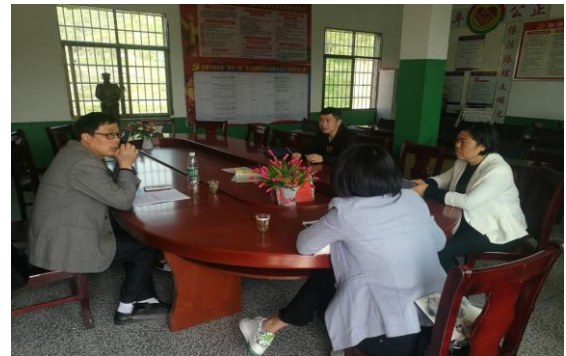
洽谈科技示范项目