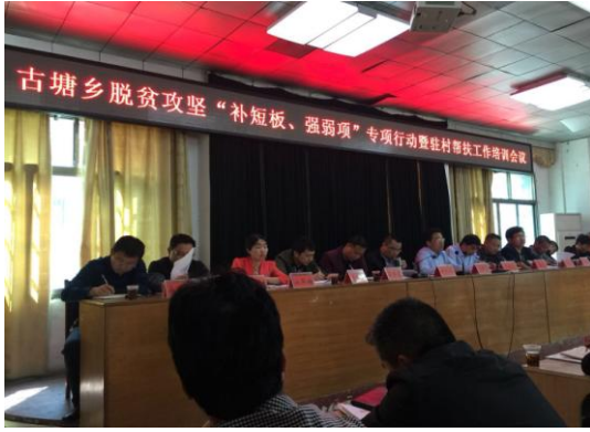
古塘乡脱贫攻坚“补短板、强弱项” 专项行动暨驻村帮扶工作培训会