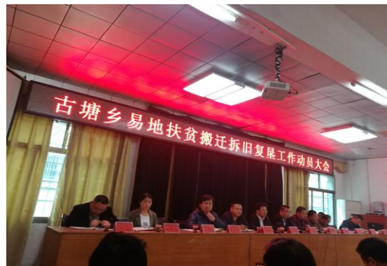
古塘乡拆旧复垦动员大会