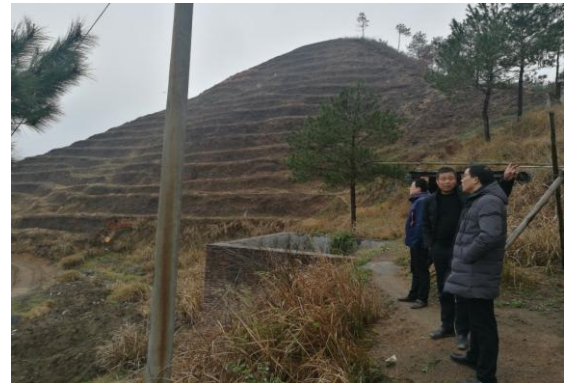
考察油茶林基地建设