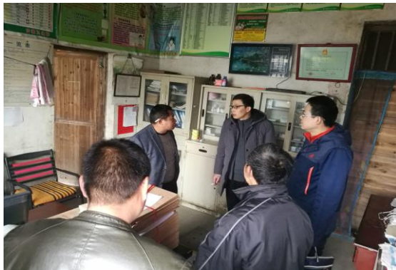
调研村卫生室建设

工作队一边走访村内贫困户，一边调研村里基础设施和产业发展现状。提出了完善村卫生室、村公共服务中心建设的设想，要求加快村光伏电站的建设，为了建设村里的300亩油茶基地，工作队带领部分村干部赴新化县采购油茶苗。根据申家村土壤富硒的天然优势，工作队与村干部、村民代表多次协商研讨，做出了发展富硒米和富硒走山鸡，恢复蝮蛇养殖的产业发展思路，提出发展富硒水与生态农庄经济的中远期致富规划，申报农村科技助力示范项目，助推乡村脱贫与产业发展。